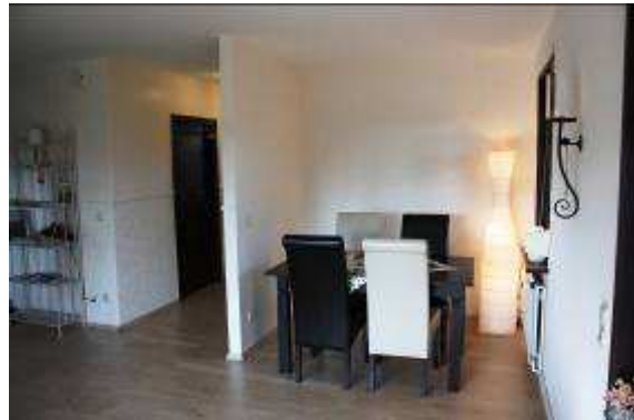
Wohnraum mit Essbereich